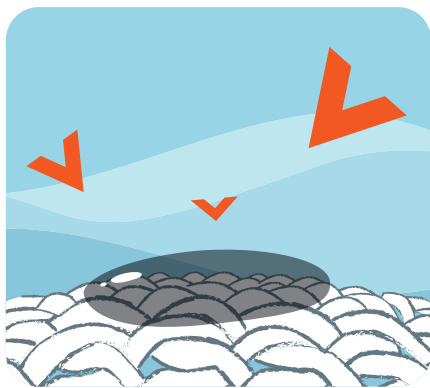
Enzymy pôsobia na škvŕny

Vysoko účinné zložky, ktoré zabezpečia výnimočné odstraňovanie škvŕn a čistenie tých najodolnejších škvŕn po profesionálnom použití.